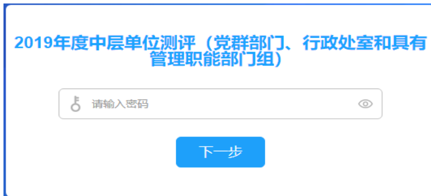
图 1 输入密码界面

测评人员登录学校办公系统，打开邮箱链接后进入以下界面（图 1），输入密码（个人工号）后，进入测评界面（电脑端图 2 或手机端图 3）。测评人员在中层单位后面选择等级，并对其工作成效提出反馈意见。填写完成后点“提交”按钮即完成匿名测评。