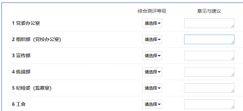
图 2 电脑端测评打分界面